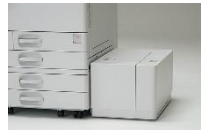
1000枚給紙と1600枚給紙トレイ