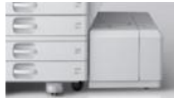
1000枚給紙と1200枚給紙トレイ